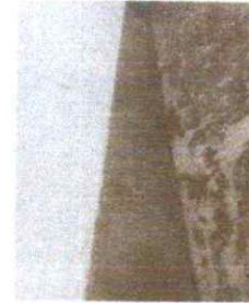
REPARACIÓN DEL MURO DE CONTENCIÓN