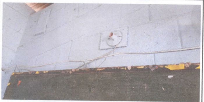
Foto 9. Sustrucción de plafoneras y focos ahorradores.