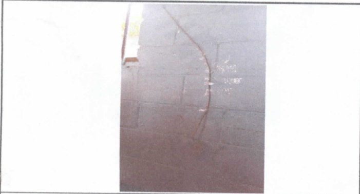
Foto 7. Sustrucción de tomacorrientes dobles.