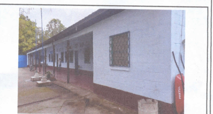
Foto 12. Área a remozar. 10 metros de ancho por 40 metros de largo.

Observación: Si es necesario se pueden agregar hojas adicionales y actualizar el número de hojas.