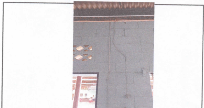
Foto 8. Sustrucción de interruptores dobles.