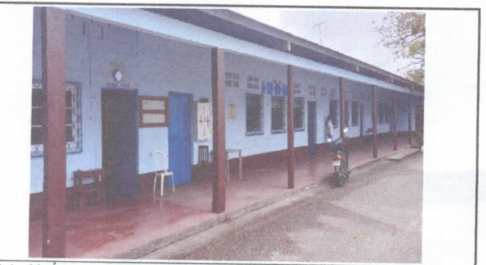
Foto 11. Área a remozar. 10 metros de ancho por 40 metros de largo.