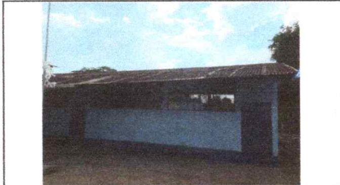
Foto1: Sustrucción de lámina, por lámina troquelada aluzinc calibre 26