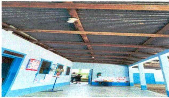
Foto1: Sustitución de estructuras de soporte de metal por metal