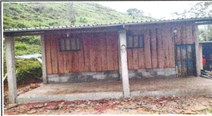
Sustitución de piso de torta de concreto en el corredor del establecimiento