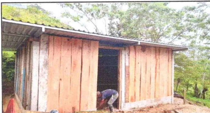
Sustitución de piso de torta de concreto y lámina de cocina del establecimiento