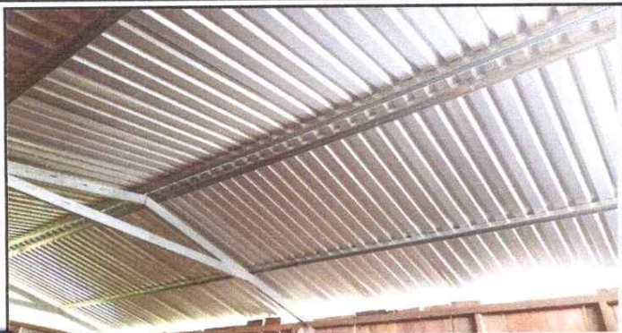
Sustitución de estructura de soporte de madera, por metal