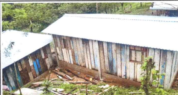
Sustitución de lámina, por lámina troquelada aluzinc calibre 26