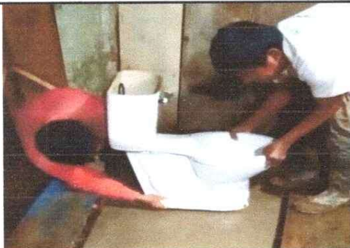
Sustitución e instalación de inodoro