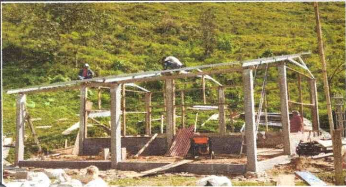
Sustitución de estructura de soporte de madera por metal