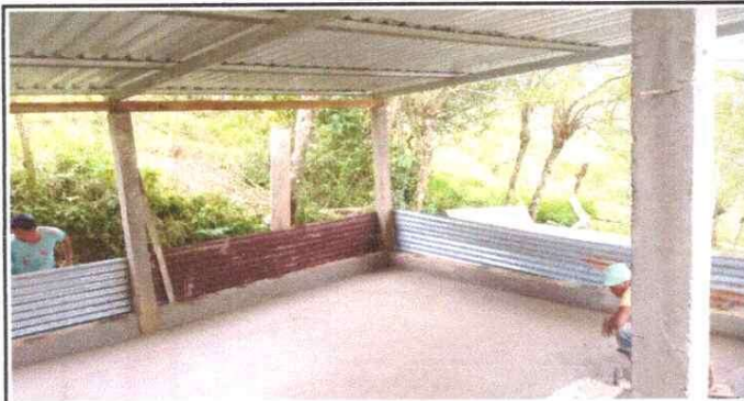
Sustitución de piso de torta de concreto de cocina del establecimiento