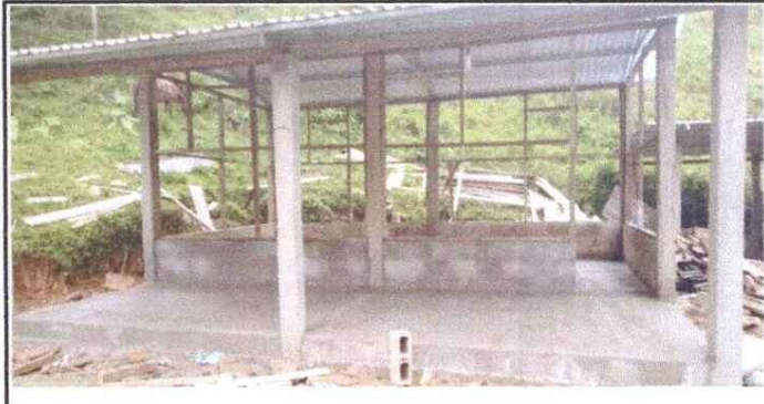
Sustitución de piso de torta de concreto