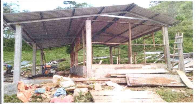
Sustitución de lámina troquelada Aluzinc calibre 26