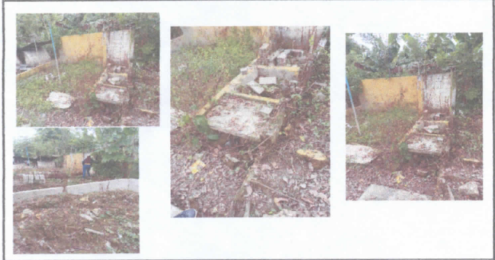
En las fotografías se visualiza lo que era el lugar donde se cocinaban los alimentos, para los niños. Fue destruido por las fuertes inundaciones de Eta y Ota.