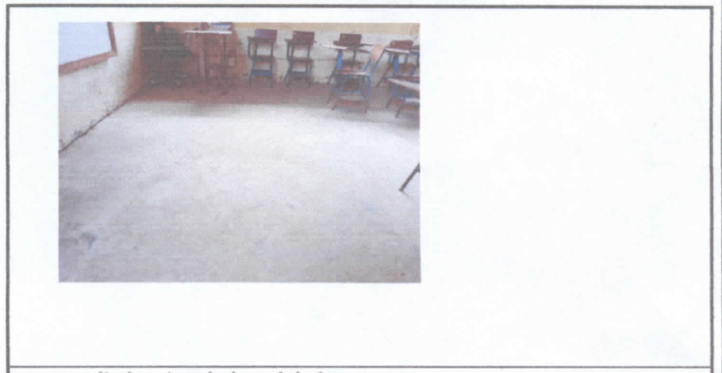
se necesita levatar el niver del piso

Observación: Si es necesario se pueden agregar hojas adicionales y actualizar el número de hojas.