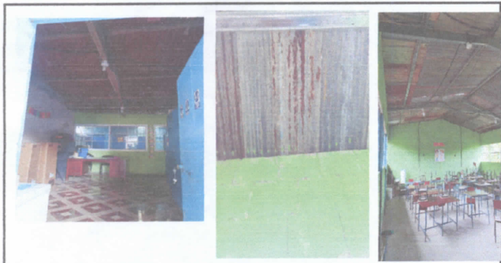
techo y estructura metalica en mal estado de direccion y de aulas