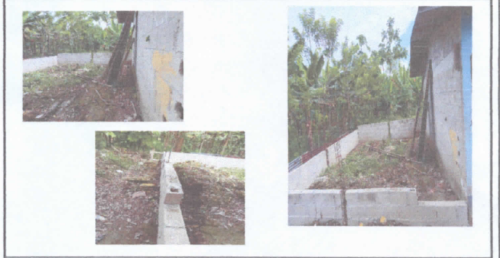
en las fotografías se puede observar el arranque de la construcción de un salón de clases.