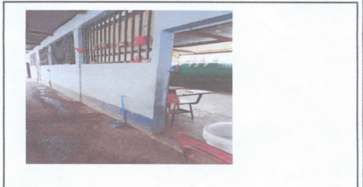
pintura en mal estado