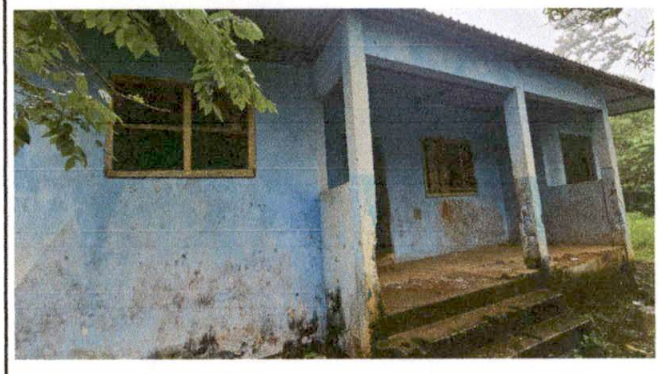
Foto 4: SUMINISTRO Y APLICACION DE PINTURA EN MUROS AULA SUMINISTRO E INSTALACION DE BALCONES DE METAL