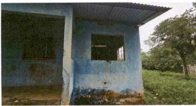
Foto7: .SUMINISTRO Y APLICACION DE PINTURA EN MUROS