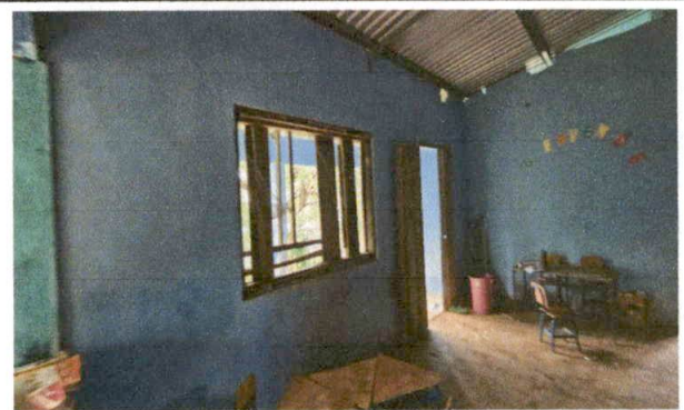
Foto 10 SUMINISTRO E INSTALACION DE VENTANAS DE PVC