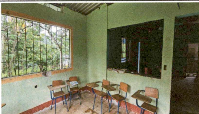
Foto 9: COLOCACION DE VENTANAS DE PVC EN AULAS DE CENTRO EDUCATIVO.