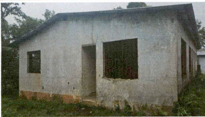
Foto 3: SUMINISTRO Y APLICACION DE PINTURA EN MUROS AULA SUMINISTRO E INSTALACION DE VENTANAS DE PVC