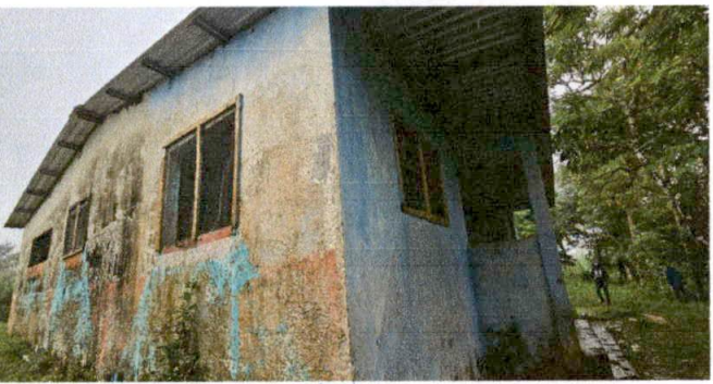
Foto 5: SUMINISTRO Y APLICACION DE PINTURA EN MUROS AULA SUMINISTRO E INSTALACION DE VENTANAS DE PVC