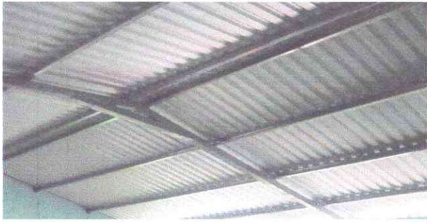
Foto1: Remozamiento de Techos de 2 aulas.