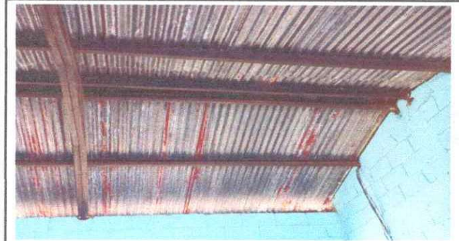
Foto1: Remozamiento de Techos de 2 aulas.