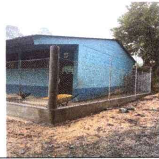
Foto 4: Reparacion de muro perimetral, con block, tubo hg y malla galvanizada