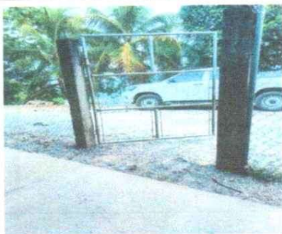
3. MANTENIMIENTO A PORTONES. MANTENIMIENTO A PORTONES DE METAL