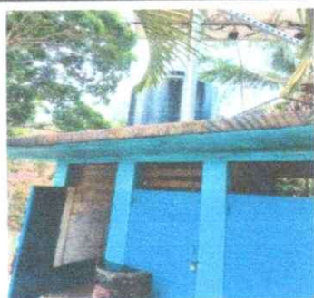
5. REPARAACION Y MANTENIMIENTO DE CISTERNAS/DEPOSITOS DE AGUA, SUSTITUCION DE DEPOSITO DE AGUA 1700 LT.