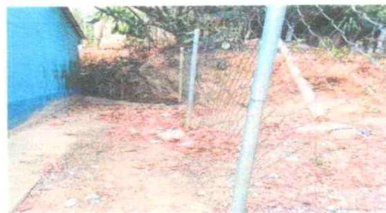
4. REPARACION DE MUROS PERIMETRALES. REPARACION DE MURO PERIMETRALDE BLOCK CON TUBO HG Y MALLA GALVANIZADA + SOLERAS