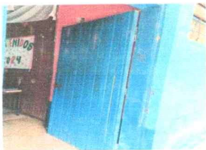
1. PUERTAS DE METAL