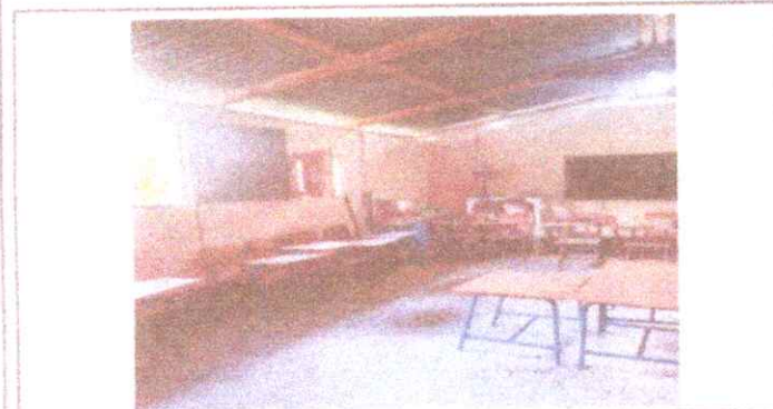
Sustitucion de Madera por Metal