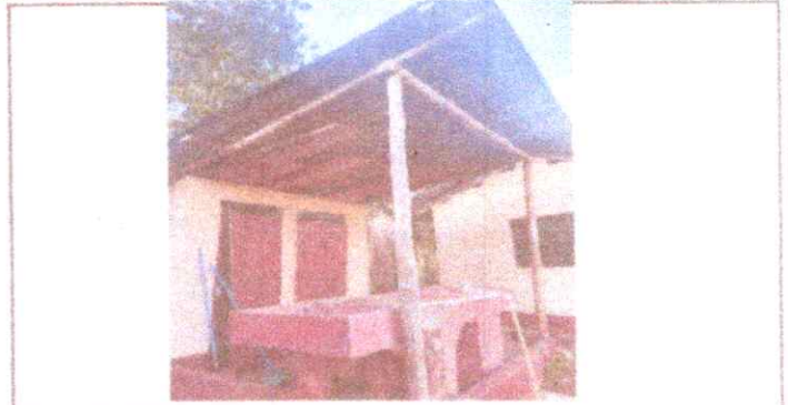
Reparación de bases de Concreto