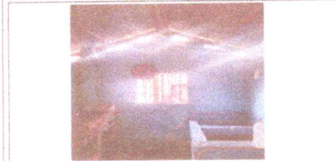
Cambio de Estufa