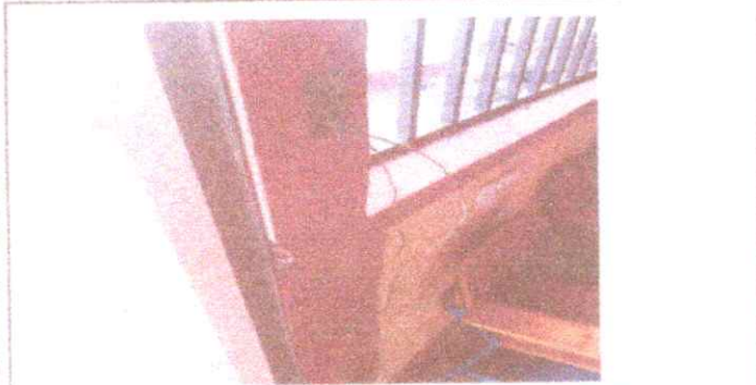
Reparación de Cableado electrico