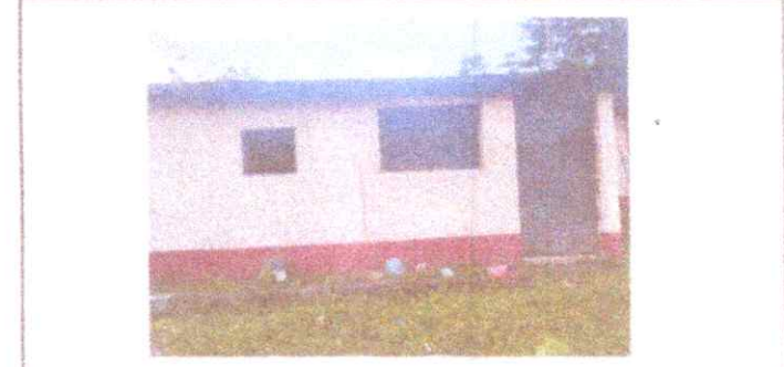
Reparación de Aula

Observación: Si es necesario se puede agregar hojas adicionales y actualizar el número de hojas.