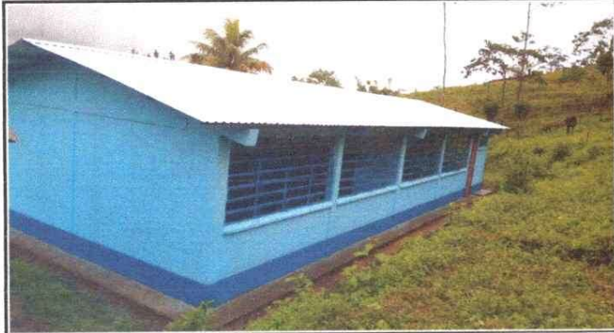
Foto 1: Establecimiento con pintura renovada en muros exteriores y renovación de techado.