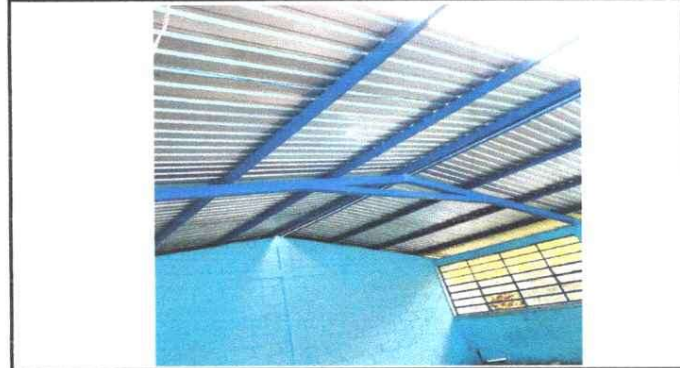
Foto 4: Mantenimiento de estructura metálica y sustitución de lámina.