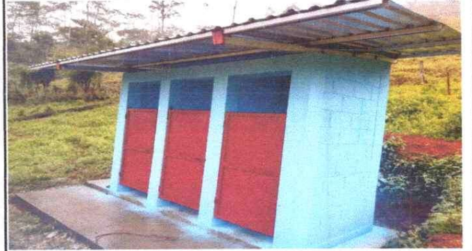
Foto 2: Baños del establecimiento con techado, pintura y renovación de puertas.