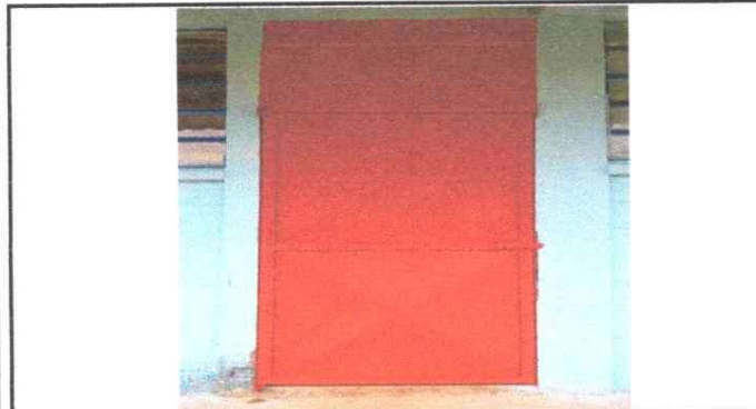
Foto 3: Puertas del establecimiento educativo con mantenimiento de puertas y renovación de pintura