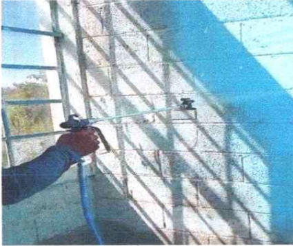
Foto 1: Renovación de pintura en muros interiores del establecimiento