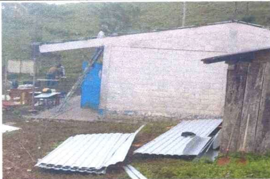
Foto 3: Sustitución de lámina duralita por lámina Troquelada Aluzinc calibre 26