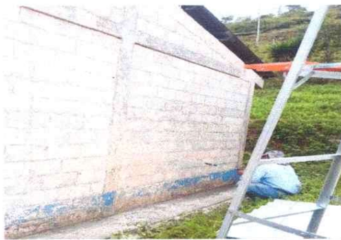
Foto 5: Renovación de pintura en muros exteriores del establecimiento