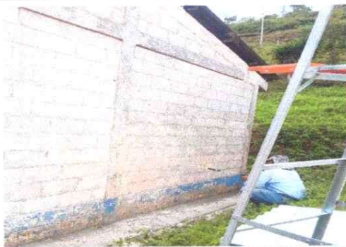
Foto 5: Renovación de pintura en muros exteriores del establecimiento

Observación: Si es necesario se pueden agregar hojas adicionales y actualizar el número de hojas.