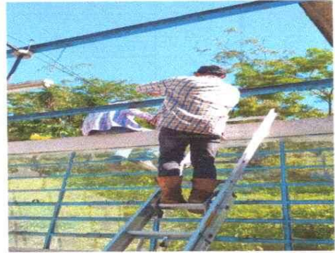
Foto 2: Sustitución y Reparación de soporte de estructura metálica del techo del establecimiento