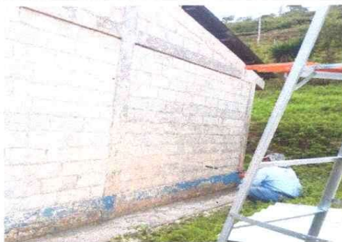
Foto 5: Renovación de pintura en muros exteriores del establecimiento