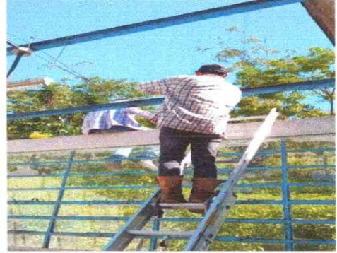
Foto 2: Sustitución y Reparación de soporte de estructura metálica del techo del establecimiento