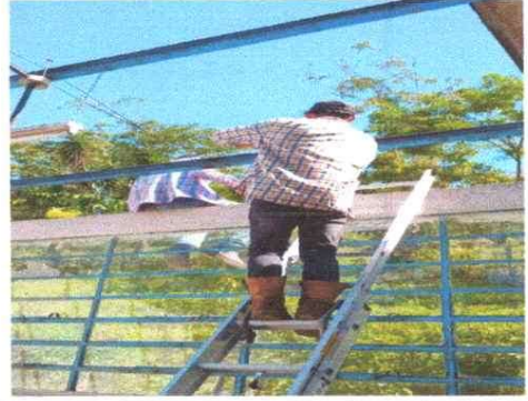
Foto 2: Sustitución y Reparación de soporte de estructura metálica del techo del establecimiento