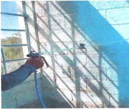
Foto1: Renovación de pintura en muros interiores del establecimiento