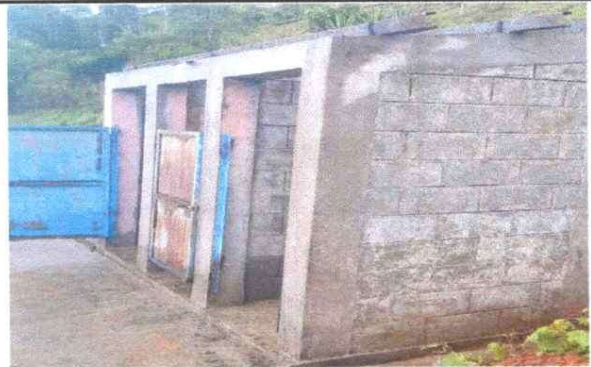
Foto 4: Mantenimiento de puertas y techo de los baños del establecimiento educativo