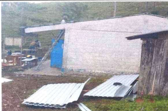
Foto 3: Sustitución de lámina duralita por lámina Troquelada Aluzinc calibre 26