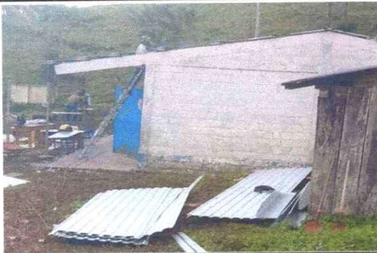
Foto 3: Sustitución de lámina duralita por lámina Troquelada Aluzinc calibre 26