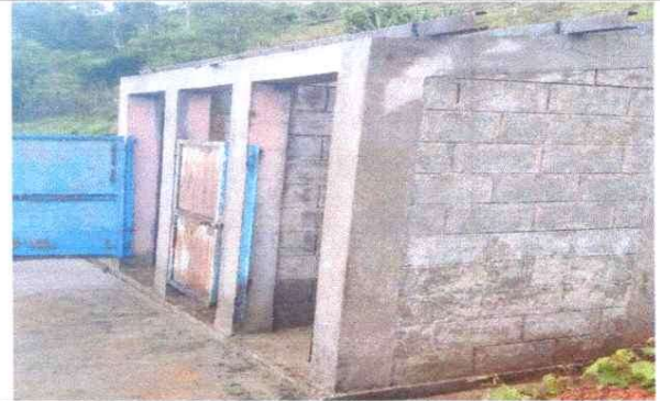
Foto 4: Mantenimiento de puertas y techo de los baños del establecimiento educativo