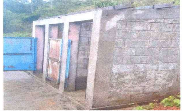
Foto 4: Mantenimiento de puertas y techo de los baños del establecimiento educativo