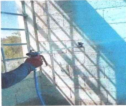
Foto1: Renovación de pintura en muros interiores del establecimiento