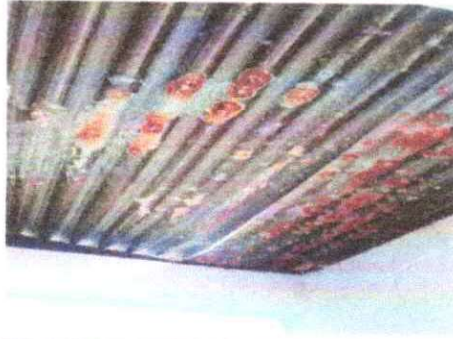
Foto 7: Sustrucción de lámina, por lámina troquelada aluzinc calibre 26