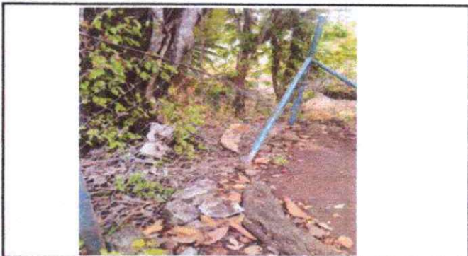
Foto 4: Reparación de muro perimetral con tubo hg y malla galvanizada