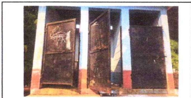
Foto 5: Mantenimiento a estructura (lijado, cambio de tubo , cepillado, sujeciones, aplicación de pintura) a puerta de baños