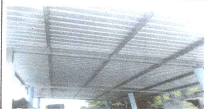
Foto 14: SUSTITUCIÓN DE ESTRUCTURA DE SOPORTE DE MADERA POR METAL