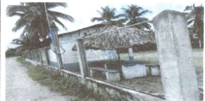
Foto 18: REPARACIÓN DE MURO PERIMETRAL DE BLOCK CON TUBO HG Y MALLA Y SOLERA

Observación: Si es necesario se pueden agregar hojas adicionales y actualizar el número de hojas.