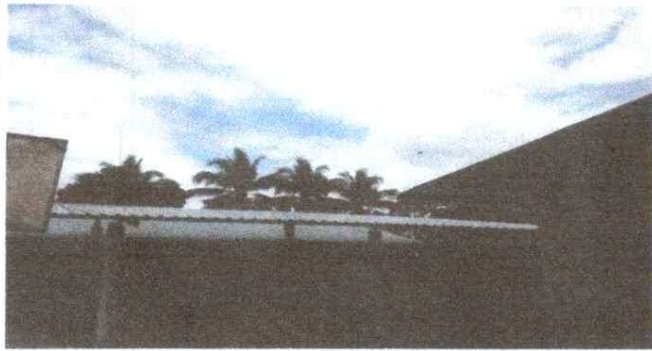
Foto 13: SUSTITUCIÓN DE LAMINA POR LAMINA TROQUELADA ALUZINC CALIBRE 26