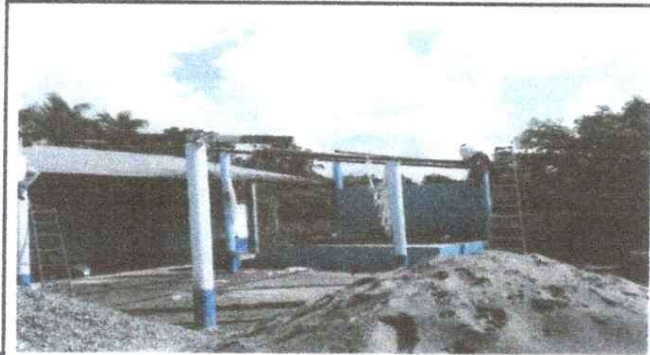
Foto 7: SUSTITUCIÓN DE LAMINA POR LAMINA TROQUELADA ALUZING CALIBRE 26