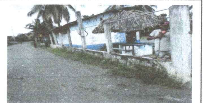
Foto 12: REPARACIÓN DE MURO PERIMETRAL DE BLOCK CON TUBO HG Y MALLA Y SOLERA

Observación: Si es necesario se pueden agregar hojas adicionales y actualizar el número de hojas.