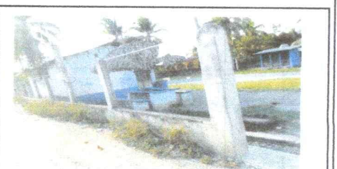
Foto 6: REPARACIÓN DE MURO PERIMETRAL DE BLOCK CON TUBO HG Y MALLA Y SOLERA

Observación: Si es necesario se pueden agregar hojas adicionales y actualizar el número de hojas.