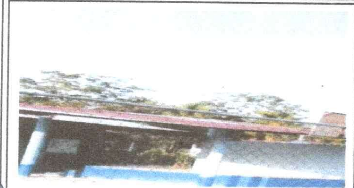
Foto 1: SUSTITUCIÓN DE LAMINA POR LAMINA TROQUELADA ALUZINC CALIBRE 26