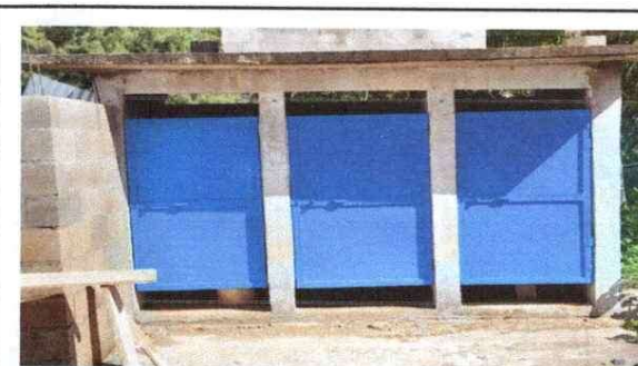
Foto 4: Mantenimiento a estructura (lijado, cambio de tubo, cepillado, aplicación de pintura) a puerta de sanitario. Reparación de torta de concreto.