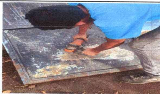
Foto 4: Mantenimiento a estructura (lijado,cambio de tubo, cepillado,aplicación de pintura) a puerta de sanitario. Reparacion de torta de concreto.