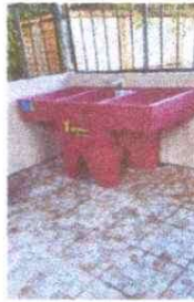
6. SUSTITUCION DE PISO CERAMICO

Observación: Si es necesario se pueden agregar hojas adicionales y actualizar el número de hojas.