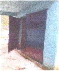
3. PUERTAS DE METAL