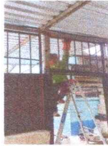
4. SUSTITUCION DE BALCONES DE METAL