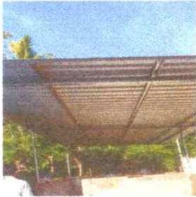
1. SUSTITUCION DE LAMINA POR LAMINA TROQUELADA ALUZINC CAL. 26