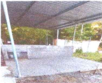
5. SUSTITUCION DE PISO DE TORTA DE CONCRETO