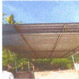
2. SUSTITUCION DE ESTRUCTURA DE SOPOSRTTE DE METAL POR METAL