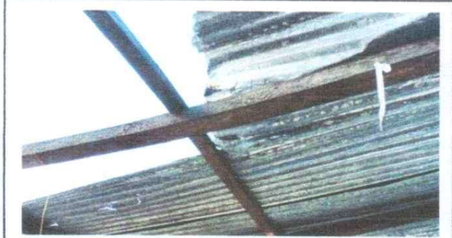
1. SUSTITUCION DE LAMINA POR LAMINA TROQUELADA ALUZINC CAL. 26