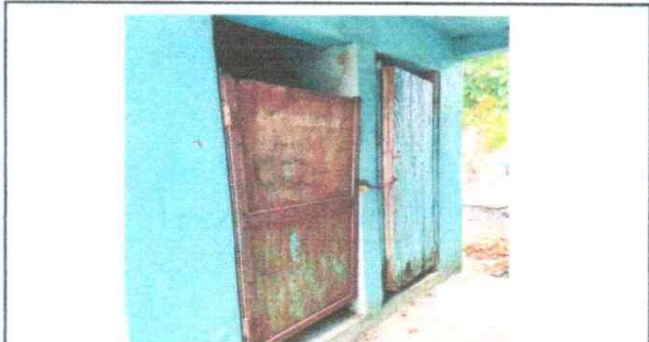
3. PUERTAS DE METAL