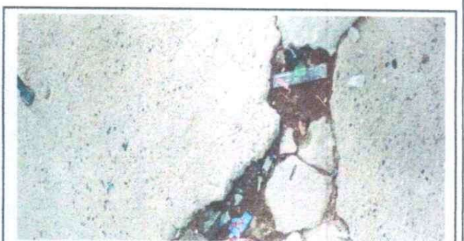
6. SUSTITUCION DE PISO CERAMICO

Observación: Si es necesario se pueden agregar hojas adicionales y actualizar el número de hojas.