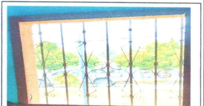
4. SUSTITUCION DE BALCONES DE METAL