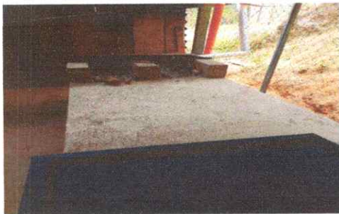
SUSTIUCION DE ESTUFA RURAL