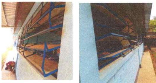
MANTENIMIENTO 80 MTS DE VENTANAS Y SUSTITUCIÓN DE VIDRIOS