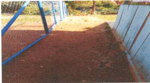
SUSTITUCIÓN DE TUBO DE AGUA PLUVIALES