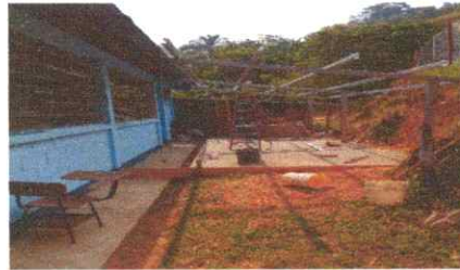
SUSTITUCIÓN DE METAL POR MADERA EN LA COCINA