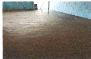
REPARACIÓN DE PISO

Observación: Si es necesario se pueden agregar hojas adicionales y actualizar el número de hojas.