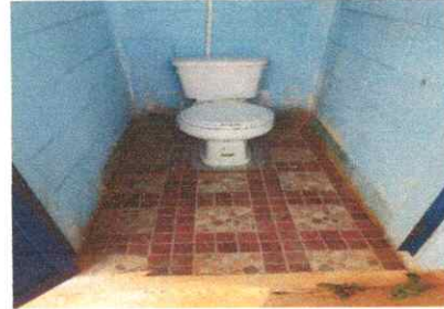
CAMBIO DE INODORO