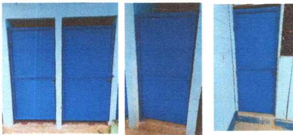
SUSTITUCIÓN DE PUERTAS DE 3 BAÑOS Y UNA AULA