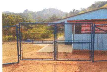
SUSTITUCIÓN DE PORTON