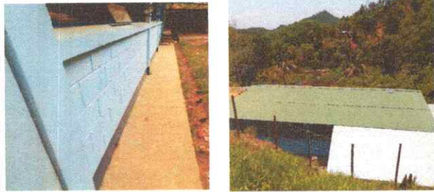
PINTURA EL MURO INTERIOR E EXTERIOR Y LAMINA