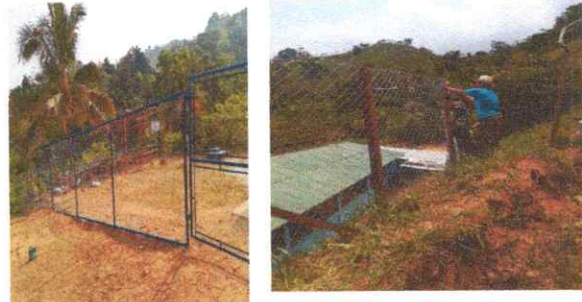
REPARACIÓN DE MURO PERIMETRAL 25 MT LINEALES CON TUBO HG Y 200 MTS CON POSTES