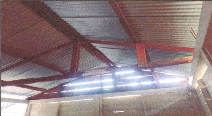
SUSTITUCIÓN DE ESTRUCTURA DE MADERA POR DE METAL Y LÁMINAS DE AULAS