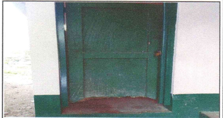
SUSTITUCIÓN DE SEIS (6) PUERTAS DE MADERA POR DE METAL PARA BAÑOS