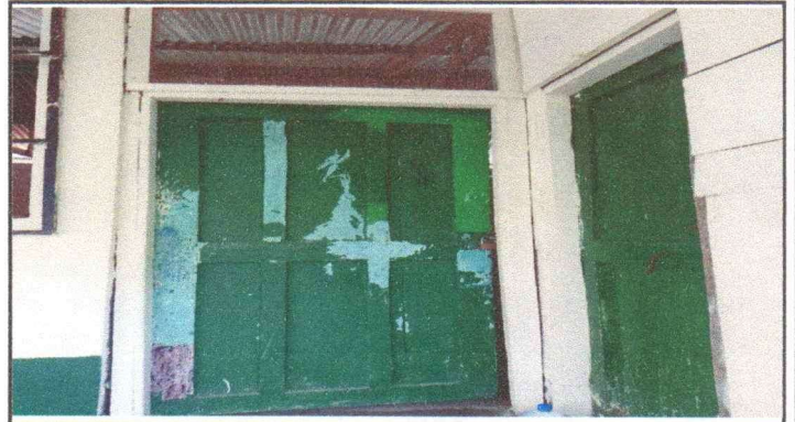
SUSTITUCIÓN DE TRES (3) PUERTAS DE MADERA POR DE METAL