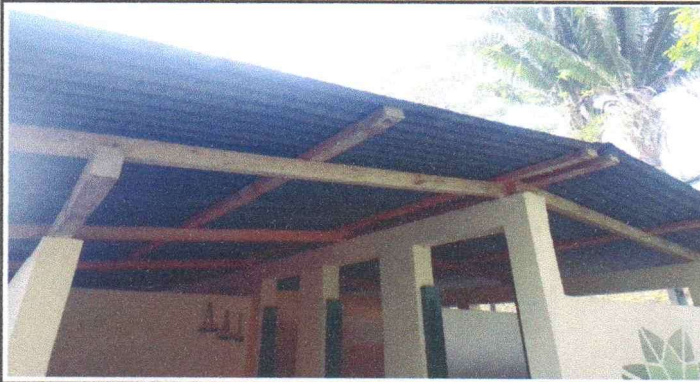
SUSTITUCIÓN DE ESTRUCTURA DE MADERA POR DE METAL Y LÁMINAS DE BAÑOS.