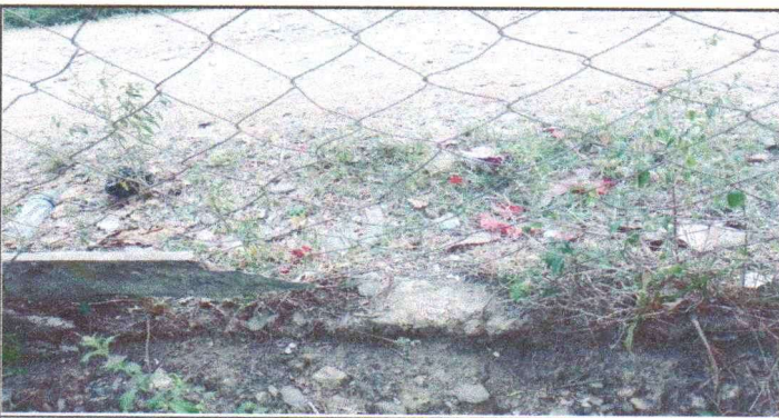
SUSTITUCION DE MAYA POR BLOCK Y MALLA GALVANIZADA.