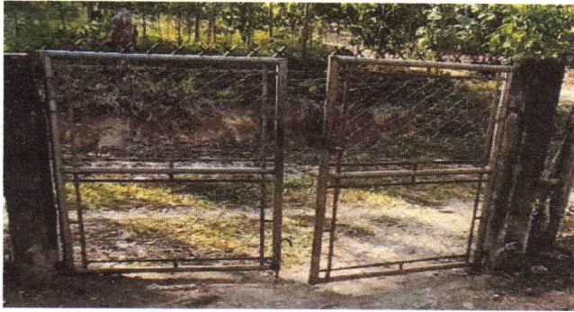
Mantenimiento a portones de metal