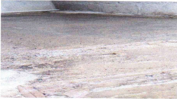
Sustitución de piso de torta de concreto