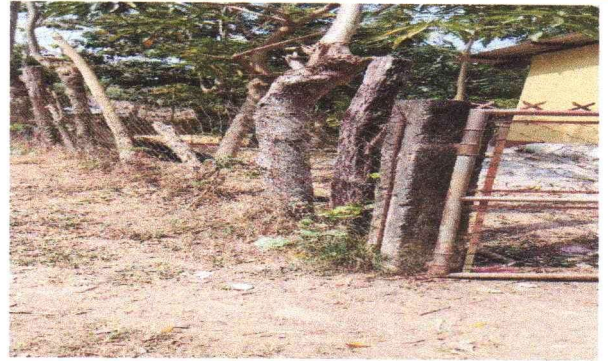
Reparación de muro perimetral