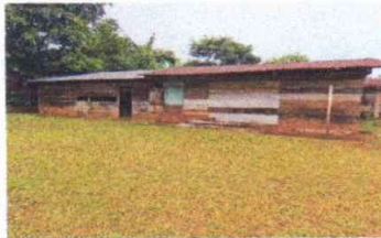
Foto1: Sustitución de lámina, por lámina troquelada aluzinc calibre 26.