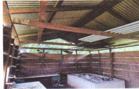
Foto 2: Sustitución de estructura de soporte de madera, por metal.