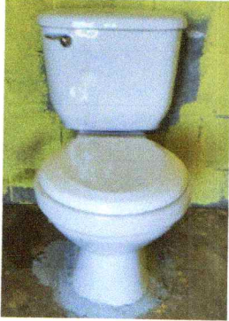
Foto1: Sustitucion de sanitario