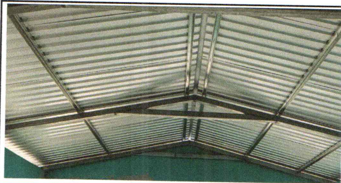
Foto 5: sustitucion de estructura de madera por metal y lamina troquelada.