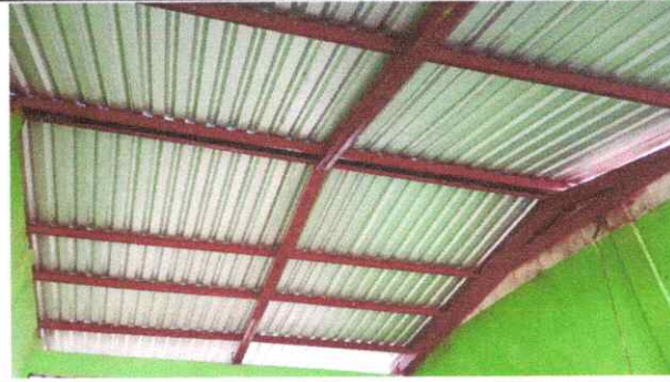
Foto 2: FINALIZACIÓN DE SUSTITUCION DE ESTRUCTURA DE METAL EN MAL ESTADO