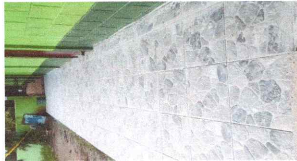
Foto 4: FINALIZACIÓN Y CAMBIO DE PISO DE TORTA POR PISO CERAMICO ANTIDESLIZANTE