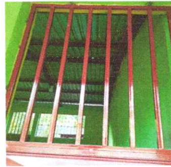
Foto 6: FINALIZACIÓN DE SUSTITUCIÓN DE VENTANA DE MADERA POR BALCONES

Observación: Si es necesario se pueden agregar hojas adicionales y actualizar el número de hojas.