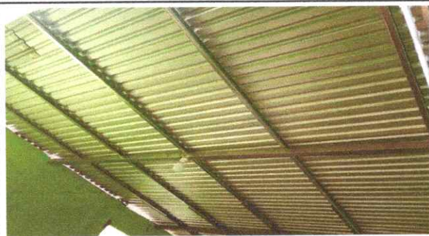
Foto1: FINALIZACIÓN DE SUSTITUCION DE LAMINA POR LAMINA TROQUELADA