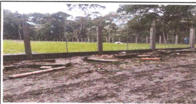
FOTO 5. REPARACIÓN DE MURO PERIMETRAL.