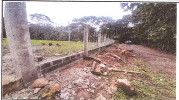
FOTO 2. REPARACIÓN DE MURO PERIMETRAL.