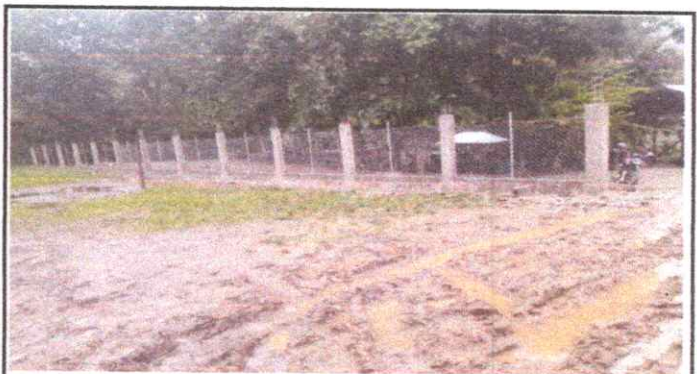
FOTO 4. REPARACIÓN DE MURO PERIMETRAL.