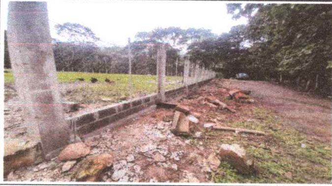
FOTO 1. REPARACIÓN DE MURO PERIMETRAL.