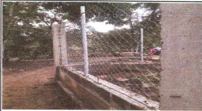
FOTO 3. REPARACIÓN DE MURO PERIMETRAL.