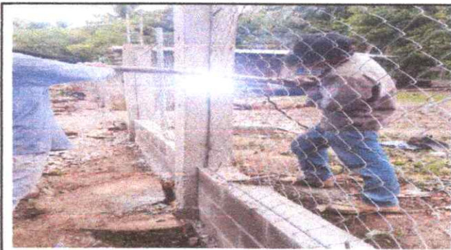
FOTO 5. REPARACIÓN DE MURO PERIMETRAL.

Observación: Si es necesario se pueden agregar hojas adicionales y actualizar el número de hojas.