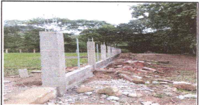
FOTO 4. REPARACIÓN DE MURO PERIMETRAL.