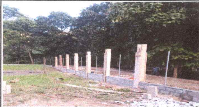
FOTO 3. REPARACIÓN DE MURO PERIMETRAL.