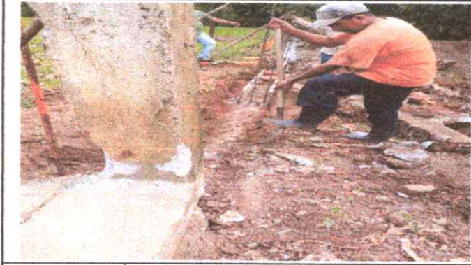
FOTO. REPARACIÓN DE MURO PERIMETRAL.