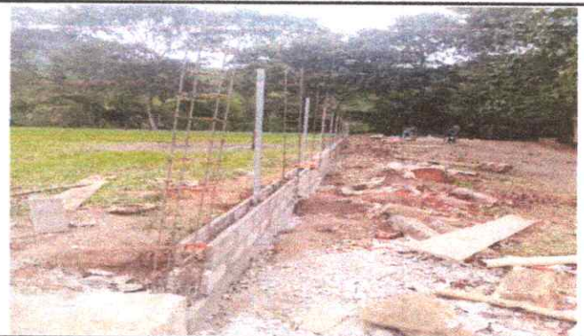
FOTO 2. REPARACIÓN DE MURO PERIMETRAL.