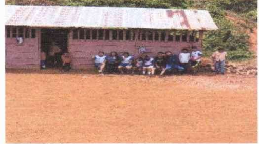
FOTO 2: SUSTITUCION DE ESTRUCTURA DE SOPORTE DE MADERA, POR METAL