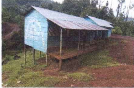
FOTO 1: SUSTITUCIÓN DE LAMINA, POR LÁMINA TROQUELADA ALUZINC CALIBRE 26