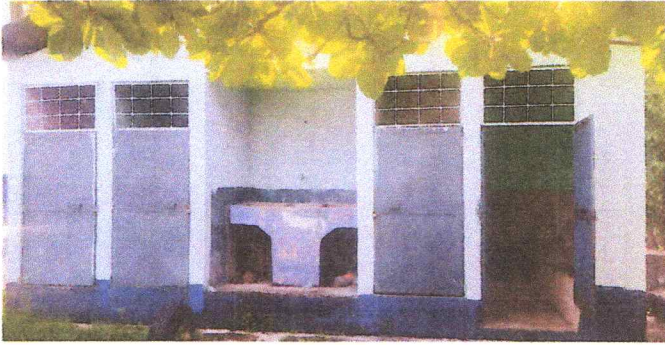
Foto7: sustitucion de inodoro / sustitucion de grifos