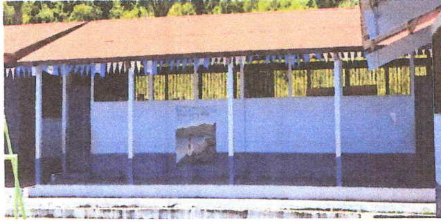
Foto1: SUSTITUCION DE LAMINAS