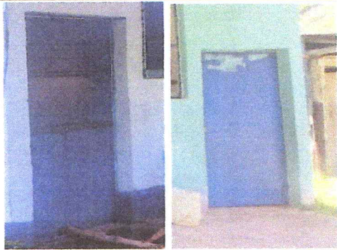
Foto 3: mantenimiento a estructura (lijado, cambio de tuvo, cepillado, sujecciones, aplicación de pintura)