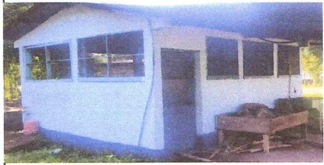
Foto 4: sustitucion de ventanas de madera por metal mas vidrio / sustituciones de balcones de metal.