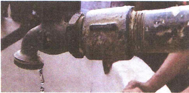
Foto 9: sustitucion de tuveria linea principal / sustitucion de llave de chorro / sustitucion de llave de cheque