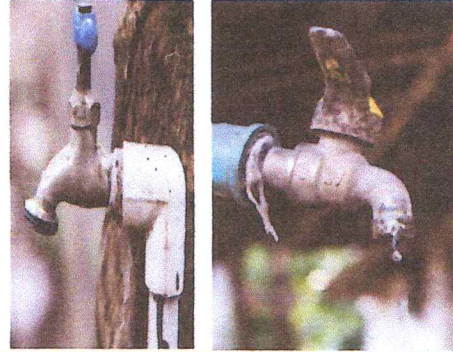
Foto 8: sustitucion de tuveria linea principal / sustitucion de llave de chorro / sustitucion de llave de cheque