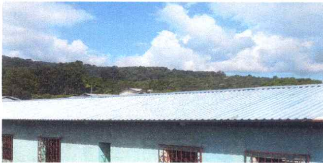
FOTO 1: SUSTITUCIÓN DE LAMINA POR LAMINATRQUELADA ALUZINC CALIBRE 26