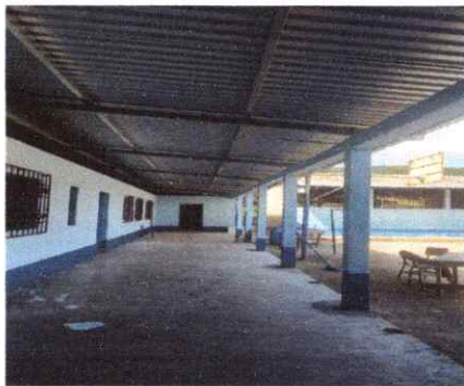
FOTO 3: SUSTITUCION DE ESTRUCTURA DE SOPORTE DE MANDERA POR METAL

Observación: Si es necesario se pueden agregar hojas adicionales y actualizar el número de hojas.