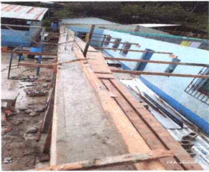
FOTO 3: SUSTITUCION DE ESTRUCTURA DE SOPORTE DE MANDERA POR METAL

Observación: Si es necesario se pueden agregar hojas adicionales y actualizar el número de hojas.