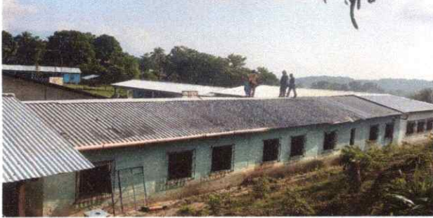
FOTO 1: SUSTITUCIÓN DE LAMINA POR LAMINATRQUELADA ALUZINC CALIBRE 26