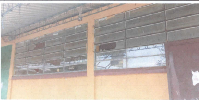
Sustitución de balcones de metal