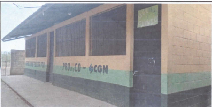
Mantenimiento a estructura (lijado, cambio de tubo, cepillado, sujeciones, aplicación de pintura)