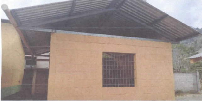
Sustitución de lámina, por láminas troqueladas Aluzin calibre 26