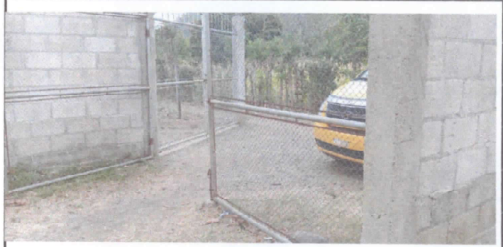
Mantenimiento de portones