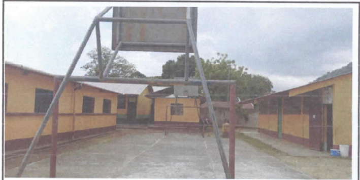
Pintura en muros exteriores e interiores