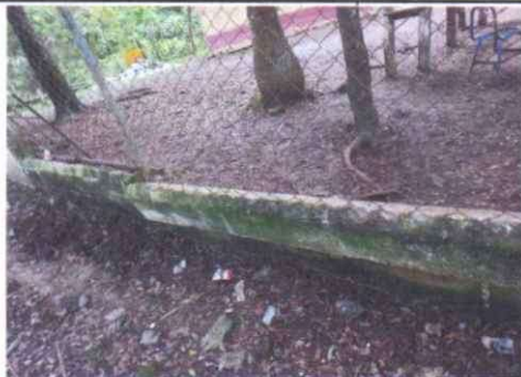
Foto 3: Reparación de muro perimetral de block con tubo HG y malla galvanizada, solera intermedia y columnas