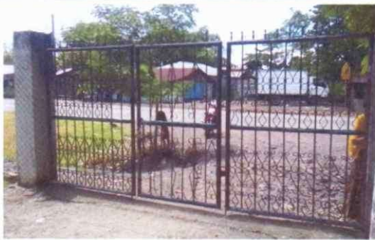
Foto1: Sustrutitución de portón de metal