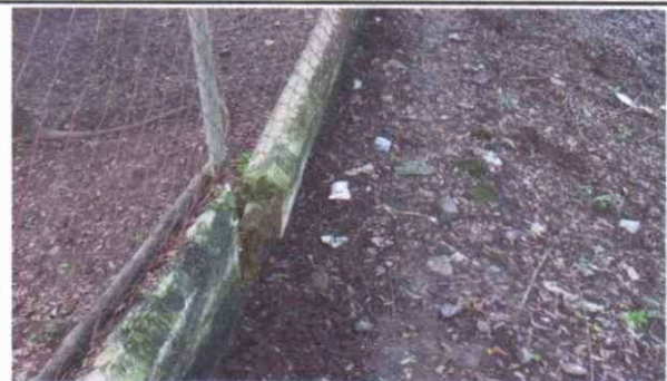
Foto 4: Reparación de muro perimetral de block con tubo HG y malla galvanizada, solera intermedia y columnas