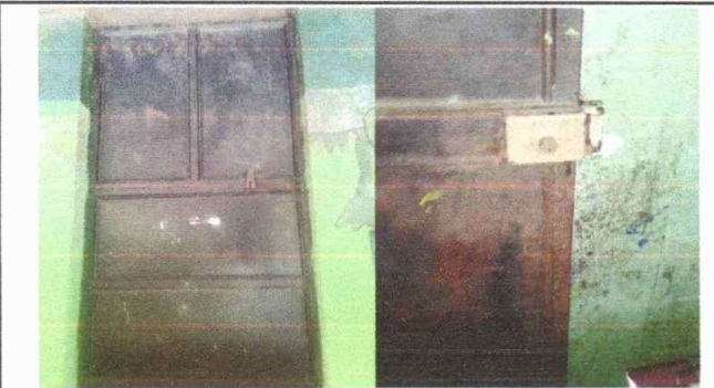
Foto 3: MATENIMIENTO A ESTRUCTURAS DE METAL. PUERTAS, BALCONES Y CHAPAS.