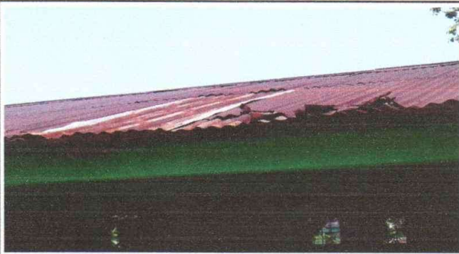
Foto1: SUSTITUCION DE LÁMINA POR LÁMINA TROQUELADA