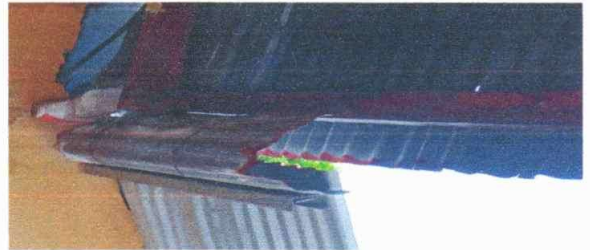
Foto 4: INSTALACIÓN DE CANAES DE METAL, SECANTES Y BAJADAS DE AGUA