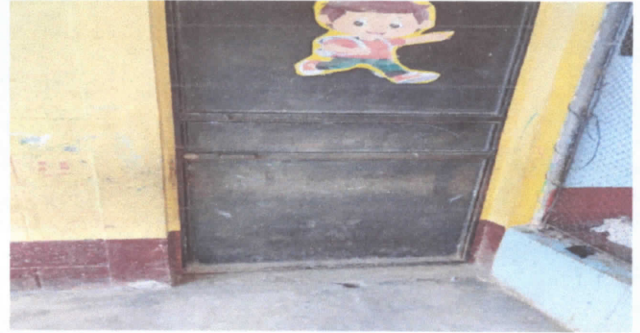
Mantenimiento a estructura (lijado, cambio de tubo, cepillado, sujeciones, aplicación de pintura)