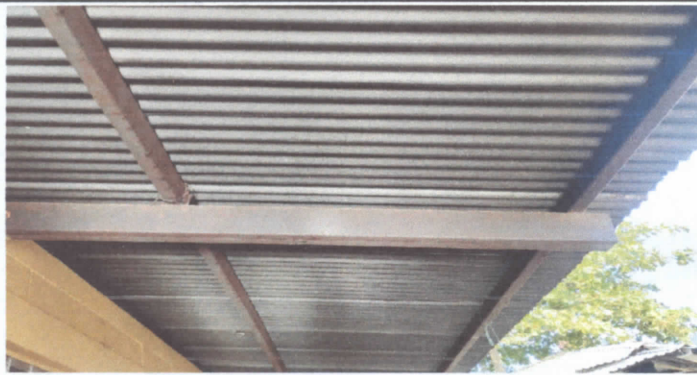
Mantenimiento a estructura de soporte de metal