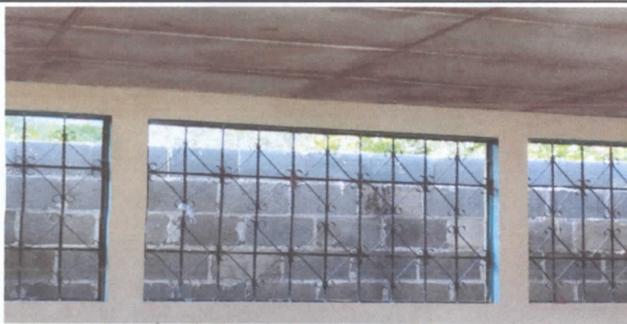
Mantenimiento a estructura de metal de ventana