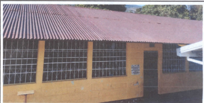
Sustitucion de ducto electrico + accesorios

Observación: Si es necesario se pueden agregar hojas adicionales y actualizar el número de hojas.