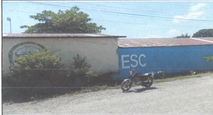
Sustitución de lámina, por láminas troqueladas Aluzin calibre 26