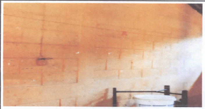
Pintura en muros exteriores e interiores