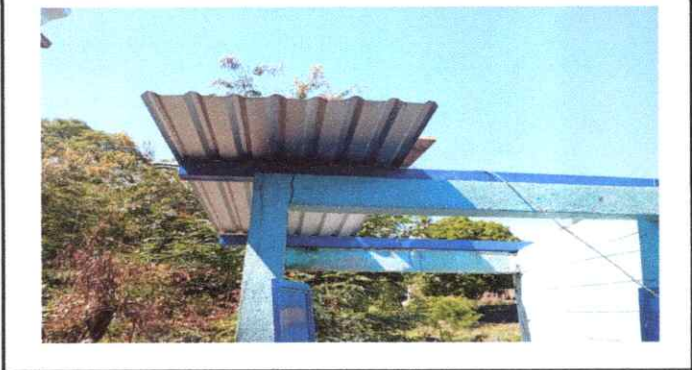
FOTO 1: SUSTITUCION DE LÁMINA, POR LÁMINA TROQUELA ALUZINC CALIBRE 26