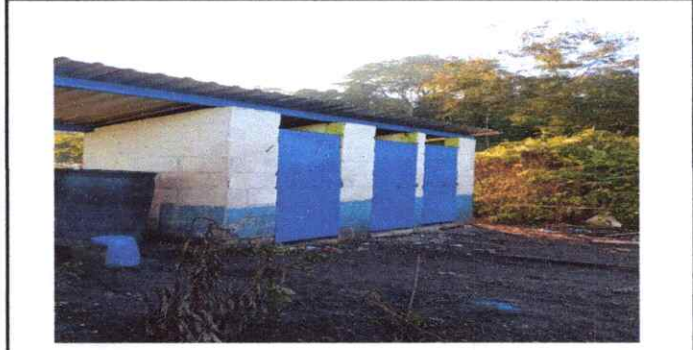
Foto 6: Pintura en muros exteriores e interiores en servicios sanattios

Observación: Si es necesario se pueden agregar hojas adicionales y actualizar el número de hojas.