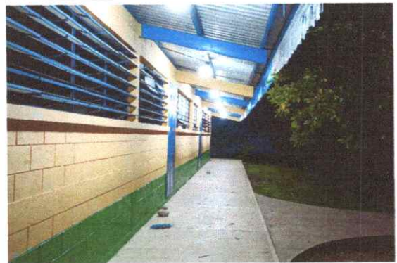
FOTO 10. SUSTITUCION DE FOCOS AHORADORAS