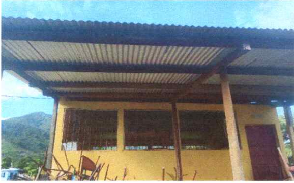
FOTO 1. SUSTITUCION DE LAMINAS POR LAMINA TROQUELADA CALIBRE 26.