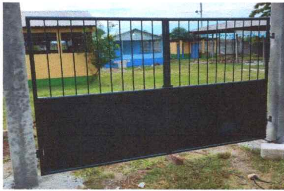
FOTO 3. SUSTITUCION DE PORTON 1, POR PORTON DE METAL.