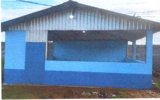
FOTO 7. PINTURA EN MUROS EXTERIORES E INTERIORES.