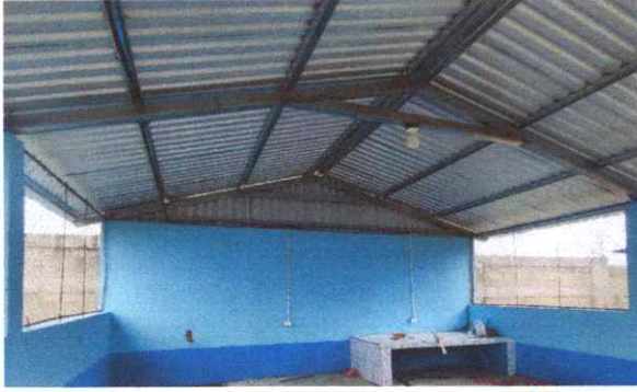
FOTO 13. SUSTITUCION DE ESTRUCTURA PORTANTE DE METAL