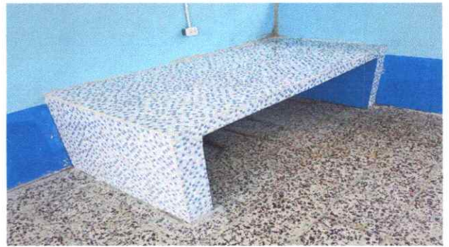
FOTO 16. REPARACION DE MESA DE CONCRETO