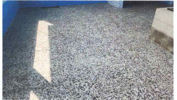
FOTO 6. SUSTITUCION DE PISO DE TORTA DE CONCRETO POR MISO GRANITO.

Observación: Si es necesario se pueden agregar hojas adicionales y actualizar el número de hojas.