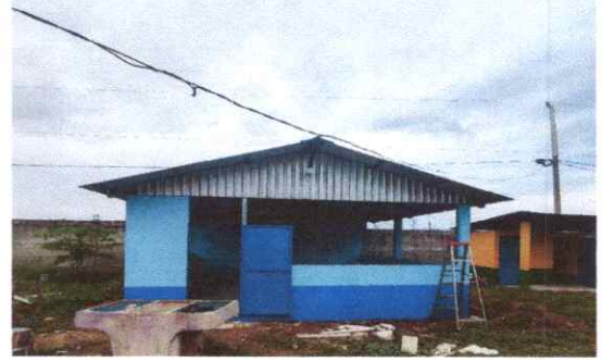
FOTO 2. SUSTITUCION DE ESTRUCTURA DE SOPORTE DE MADERA POR METAL.