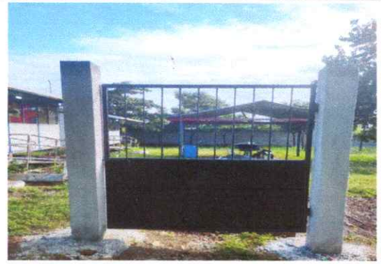
FOTO 4. SUSTITUCION DE PORTON 2, POR PORTON DE METAL.