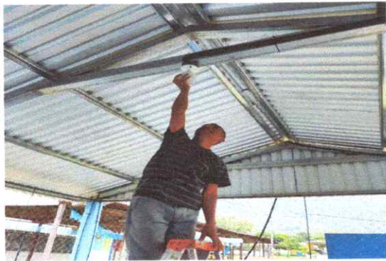
FOTO 9. SUSTITUCION DE PLAFOMERAS