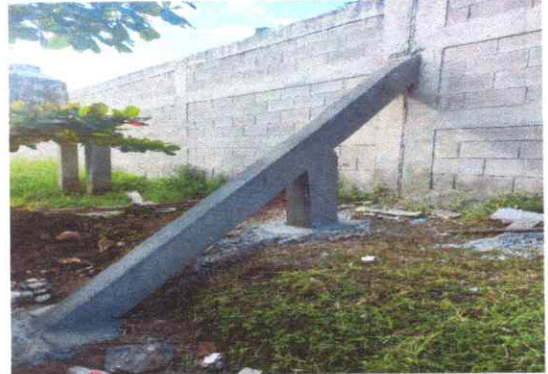
FOTO 8. REPARACION DE UNA COLUMNA DE MURO PERIMETRAL.