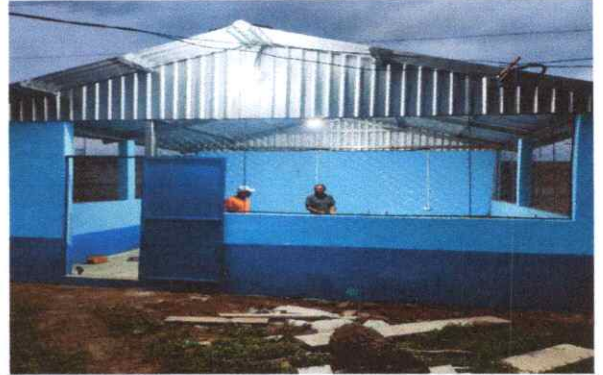
FOTO 14. INSTALACION DE LAMINAS TROQUELADA ALUZINC CALIBRE 26