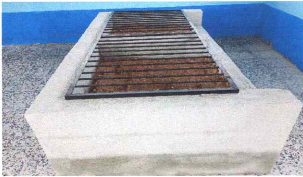
FOTO 15. MANTENIMIENTO DE ESTUFA RURAL