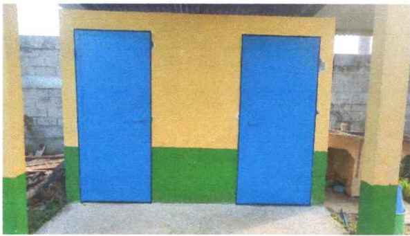
FOTO 5. SUSTITUCION DE PUERTA DE MADERA POR METAL.