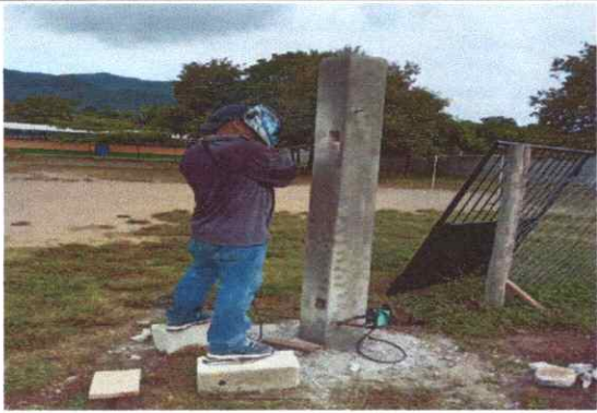
FOTO 3. SUSTITUCION DE PORTON 1, POR PORTON DE METAL.