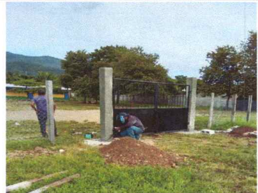
FOTO 4. SUSTITUCION DE PORTON 2, POR PORTON DE METAL.