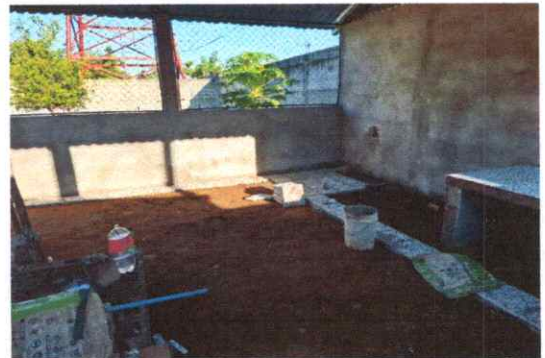
FOTO 6. SUSTITUCION DE PISO DE TORTA DE CONCRETO POR MISO GRANITO.

Observación: Si es necesario se pueden agregar hojas adicionales y actualizar el número de hojas.