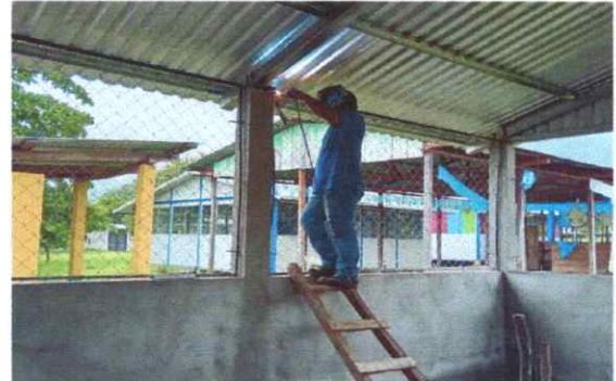
FOTO 12. SUSTITUCION DE MALLA DE COCINA RURAL

Observación: Si es necesario se pueden agregar hojas adicionales y actualizar el número de hojas.