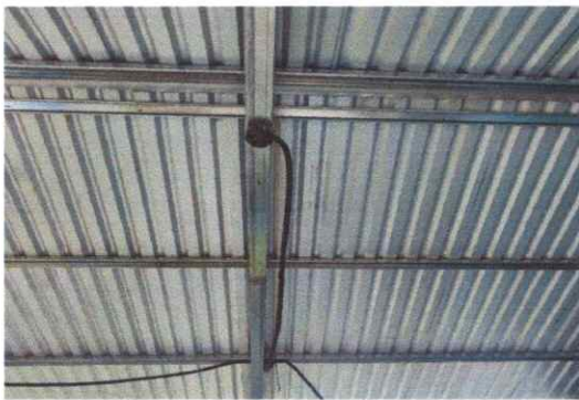
FOTO 9. SUSTITUCION DE PLAFOMERAS