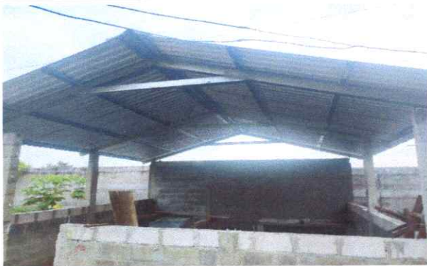
FOTO 13. SUSTITUCION DE ESTRUCTURA PORTANTE DE METAL