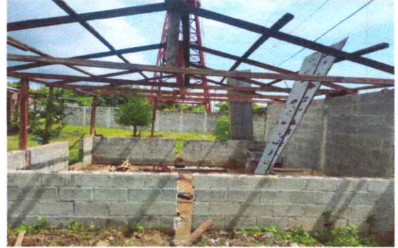
FOTO 2. SUSTITUCION DE ESTRUCTURA DE SOPORTE DE MADERA POR METAL.