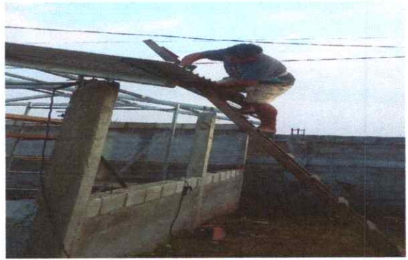
FOTO 14. INSTALACION DE LAMINAS TROQUELADA ALUZINC CALIBRE 26