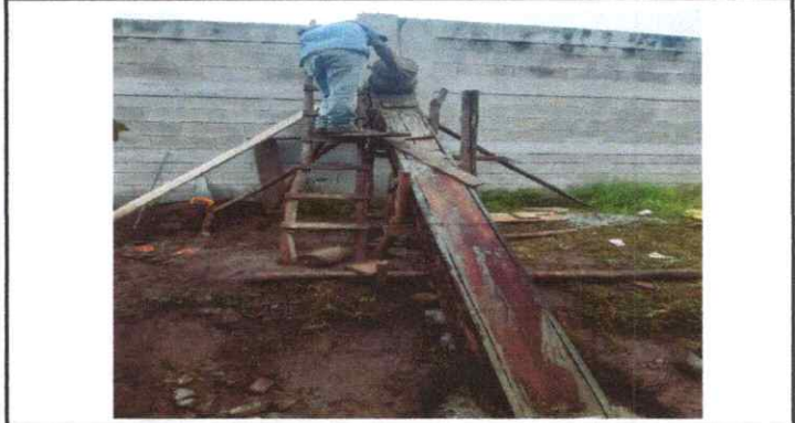
FOTO 8. REPARACION DE UNA COLUMNA DE MURO PERIMETRAL.