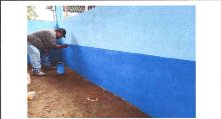
FOTO 7. PINTURA EN MUROS EXTERIORES E INTERIORES.