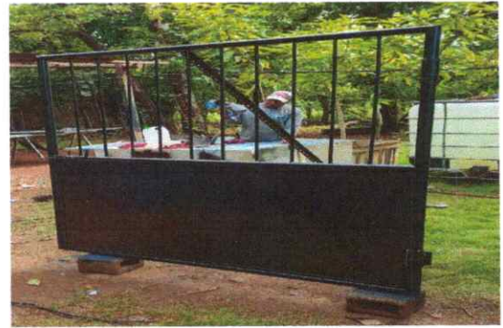
FOTO 4. SUSTITUCION DE PORTON 2, POR PORTON DE METAL.