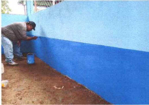
FOTO 7. PINTURA EN MUROS EXTERIORES E INTERIORES.