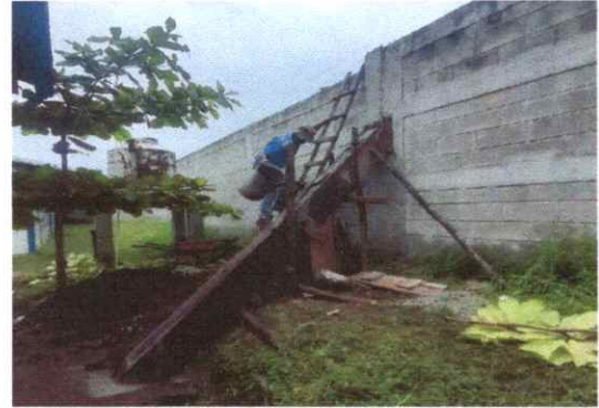
FOTO 8. REPARACION DE UNA COLUMNA DE MURO PERIMETRAL.