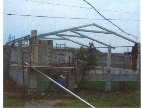
FOTO 2. SUSTITUCION DE ESTRUCTURA DE SOPORTE DE MADERA POR METAL.