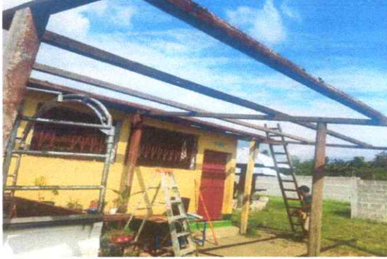
FOTO 1. SUSTITUCION DE LAMINAS POR LAMINA TROQUELADA CALIBRE 26.