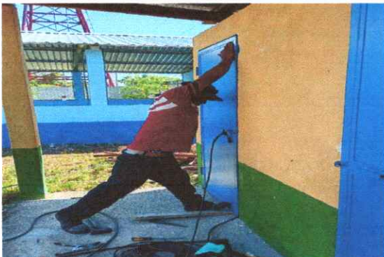
FOTO 5. SUSTITUCION DE PUERTA DE MADERA POR METAL.