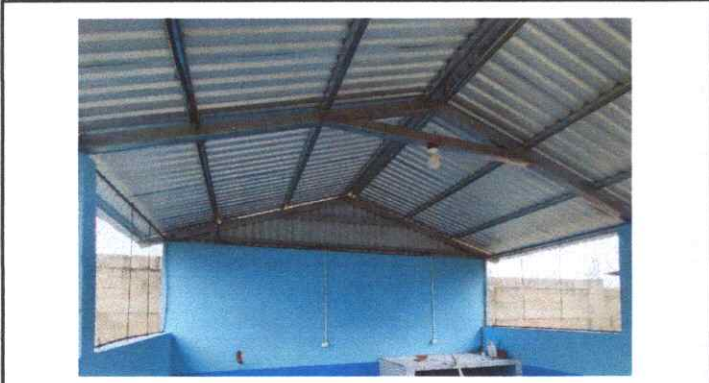
FOTO 9. SUSTITUCION DE PLAFOMERAS