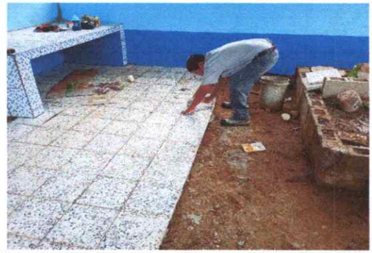
FOTO 6. SUSTITUCION DE PISO DE TORTA DE CONCRETO POR MISO GRANITO.

Observación: Si es necesario se pueden agregar hojas adicionales y actualizar el número de hojas.