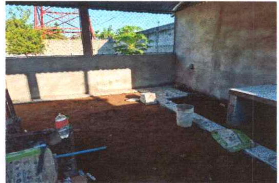
FOTO 6. SUSTITUCION DE PISO DE TORTA DE CONCRETO POR MISO GRANITO.

Observación: Si es necesario se pueden agregar hojas adicionales y actualizar el número de hojas.