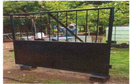
FOTO 4. SUSTITUCION DE PORTON 2, POR PORTON DE METAL.