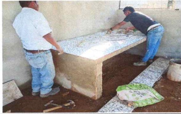
FOTO 16. REPARACION DE MESA DE CONCRETO