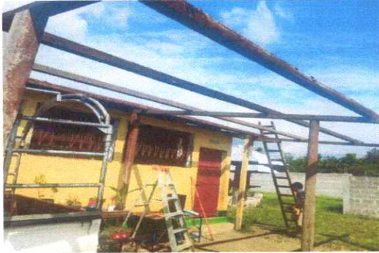
FOTO 1. SUSTITUCION DE LAMINAS POR LAMINA TROQUELADA CALIBRE 26.