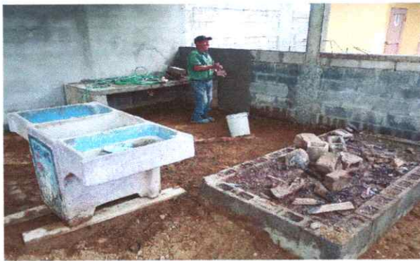
FOTO 15. MANTENIMIENTO DE ESTUFA RURAL