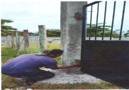
FOTO 3. SUSTITUCION DE PORTON 1, POR PORTON DE METAL.