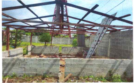
FOTO 2. SUSTITUCION DE ESTRUCTURA DE SOPORTE DE MADERA POR METAL.