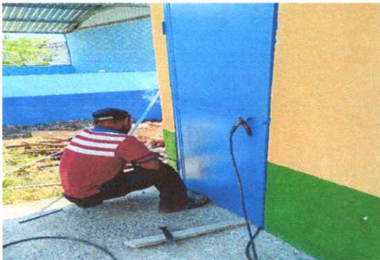
FOTO 5. SUSTITUCION DE PUERTA DE MADERA POR METAL.