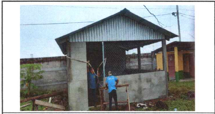
FOTO 12. SUSTITUCION DE MALLA DE COCINA RURAL

Observación: Si es necesario se pueden agregar hojas adicionales y actualizar el número de hojas.