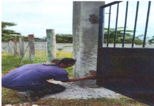
FOTO 3. SUSTITUCION DE PORTON 1, POR PORTON DE METAL.