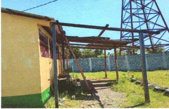
FOTO 1. SUSTITUCION DE LAMINAS POR LAMINA TROQUELADA CALIBRE 26.