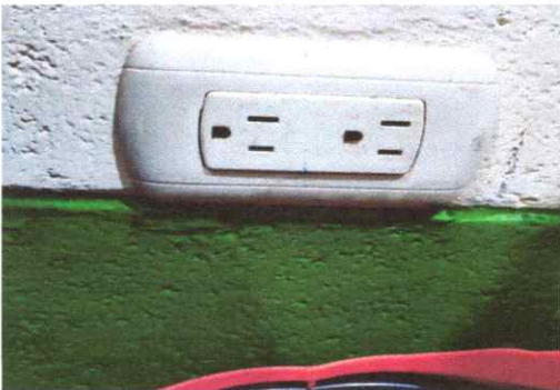
FOTO 11. SUSTITUCION DE TOMACORRIENTES DOBLES