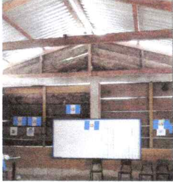
FOTO 1: Sustitución de estructura de madera por metal y sustitución de lamina por lamina troquelada.