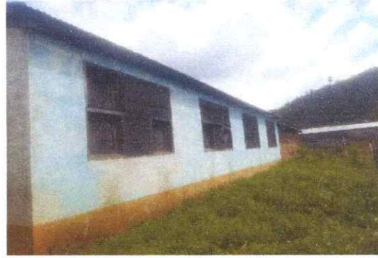
sustitución de ventanas y vbalcones