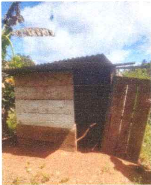
Sustitución de láminas y paredes de letrina