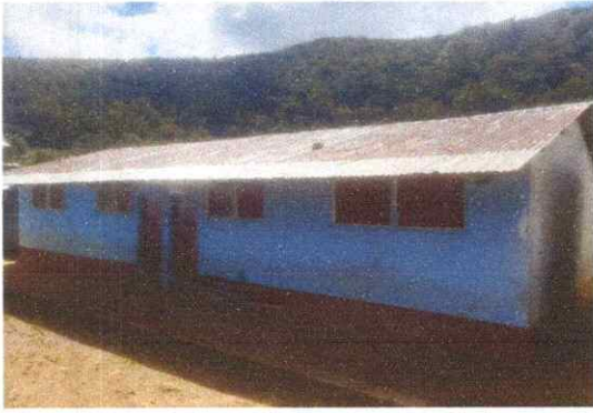
Sustitución de estructura de techo y lámina