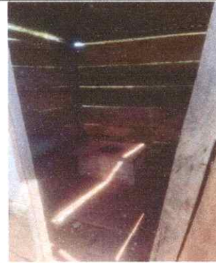
Sustitución de taza de letrina