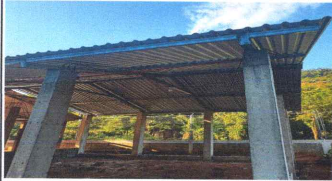
Foto 1, CUBIERTA DE LAMINA.