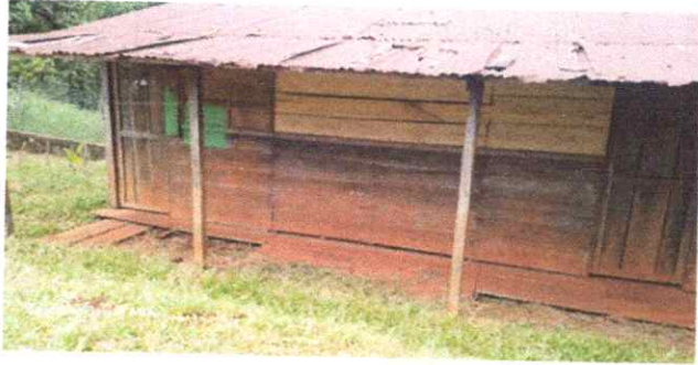
Foto1: Sustitución de lámina, por lámina troquelada aluzinc calibre 26.