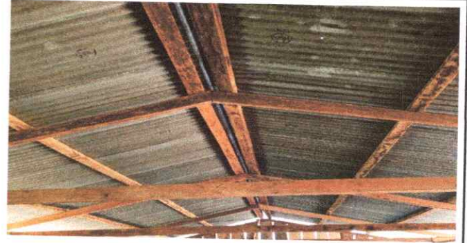
Foto 2: Sustitución de estructura de soporte de madera, por metal.