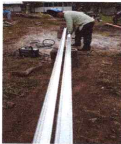
FOTO 11: ELABORACION E INSTALACION DE TECHO PARA ENTRADA PRINCIPAL

Observación: Si es necesario se pueden agregar hojas adicionales y actualizar el número de hojas.