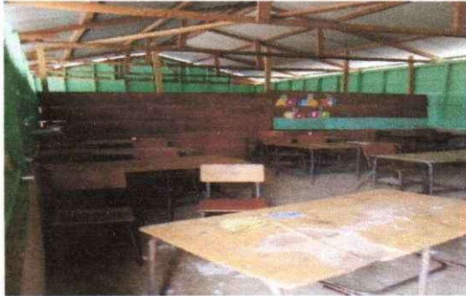
Foto1: Sustitución de lámina, por lámina troquelada aluzinc calibre 26