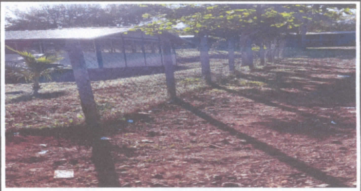
FOTO 4: Sustitución de muro perimetral de block con tubo hg y malla galvanizada, soleras intermedias y columnas.