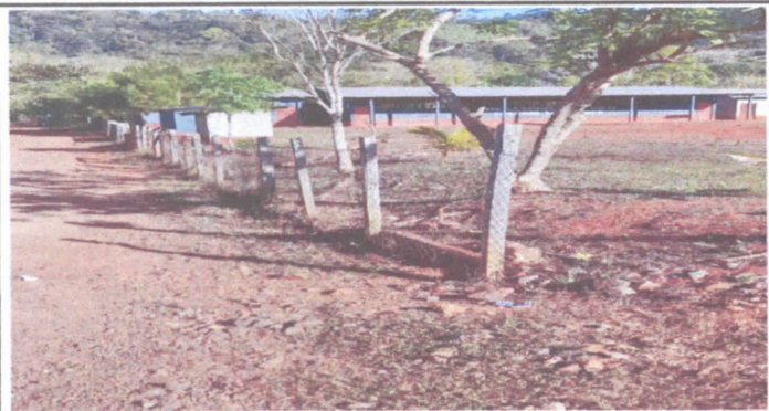
FOTO 3: Sustitución de reparación de muro perimetral de block con tubo hg y malla galvanizada, soleras intermedias y columnas.