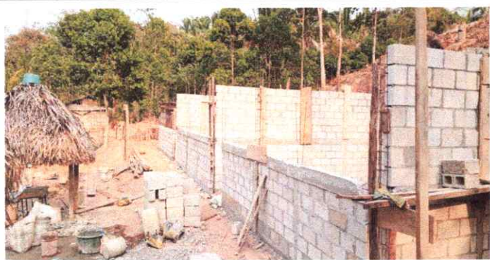
1. LEVANTAMIENTO DE MURO