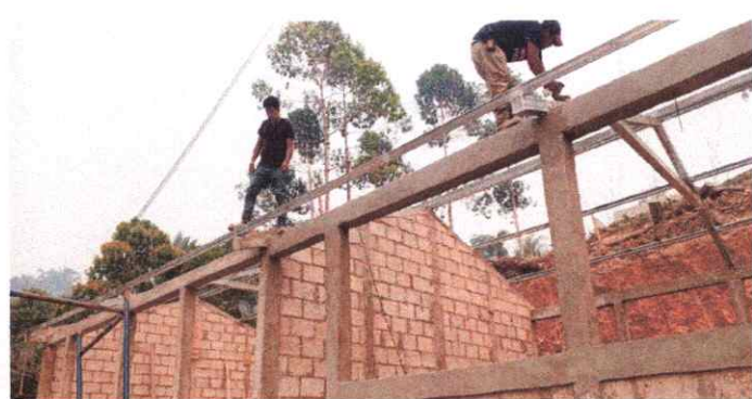
2. FABRICACION E INSTALACION DE ESTRUCTURA METALICA.