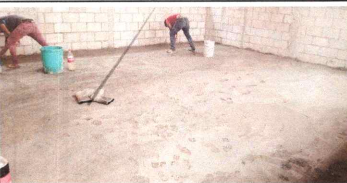
5. REMODELACION DE PISO DE TORTA A PISO DE LISO.